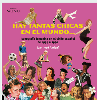
Hay tantas chicas en el mundo JUANJO ANDANÍ