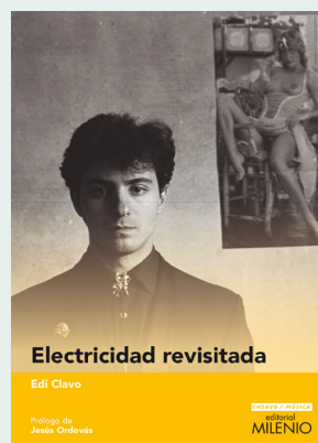
Electricidad revisitada EDI CLAVO