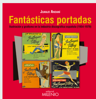
Fantásticas portadas JUANJO ANDANÍ