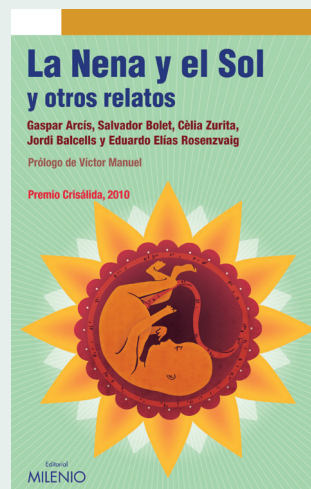
La nena y el sol y otros relatos DD.AA.