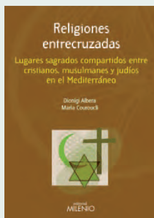
Religiones entrecruzadas D. ALBERA Y M. COURUCLÍ