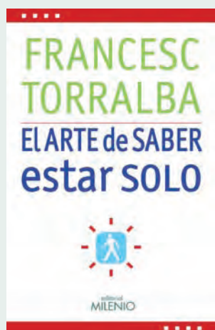
El arte de saber estar solo FRANCESC TORRALBA