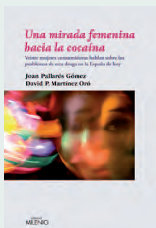
Una mirada femenina hacia la cocaína